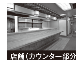
店舗(カウンター部分)